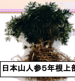
日本山人参5年根上部

日本山人参とは、天然でコエンザエム Q10 やコラーゲンなど 50 種類の成分を含む、セリ科のハーブです。 とても希少価値の高い植物 ですが、純日本製の無農薬 5 年根 100%は弊社の畑で、生産しております。